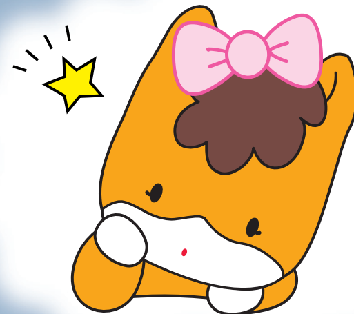
群馬県のマスコット「ぐんまちゃん」